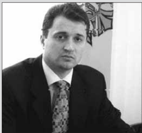
Владимир ФИЛАТ, депутат Парламента Республики Молдова

Так, согласно новому закону, обработка персональных данных (в том числе сбор, систематизация, хранение и передача) может осуществляться только с безоговорочного согласия субъекта персональных данных. За исключением случаев, предусмотренных законом. Так, без согласия субъекта персональных данных обработка персональных данных допускается в случаях, когда