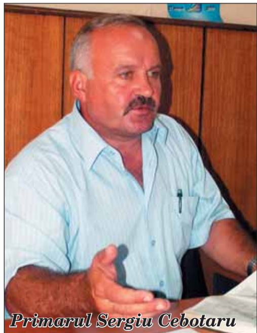
Primarul Sergiu Cebotaru

Populația din Republica Moldova este slab informată privind calitatea mediului înconjurător, iar regulamentele în vigoare nu asigură respectarea deplină a drepturilor cetățenilor de participare la procesul decizional în problemele de mediu. Potrivit raportului de evaluare a Capitolului 5 din Planul Național de Acțiuni în domeniul Drepturilor Omului (PNADO) „Asigurarea dreptului la un mediu sănătos”, care a fost făcut public în iulie 2007, a scăzut considerabil calitatea Raportului anual privind starea mediului în Republica Moldova, efectuat de către autorități. Potrivit experților, raportul, din an în an, are aceeași structură, nu toate datele pe care le conține sunt veridice și relevante. Experții au recomandat crearea unui Centru național de monitoring și informare ecologică în cadrul Ministerului Ecologiei și Resurselor Naturale. Totodată, ei consideră că ministerele și departamentele au obligația, pe site-urile lor, să actualizeze informațiile de care dispun referitoare la calitatea mediului înconjurător, să creeze baze de date privind calitatea principalelor resurse naturale ale Republicii Moldova (aerul, solul, subsolul, apele, pădurile etc.) și modul de utilizare a lor.