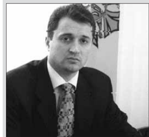
Vladimir FILAT, deputat în Parlamentul Republicii Moldova

Articolul 5 al aceleiași legi stabilește „principiile protecției datelor”, adică a datelor cu caracter personal, care trebuie: