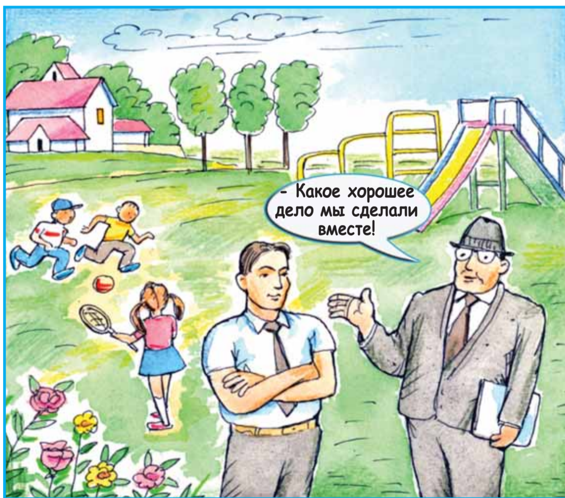
Художник МАРГАРЕТА КИЦКАТЫЙ