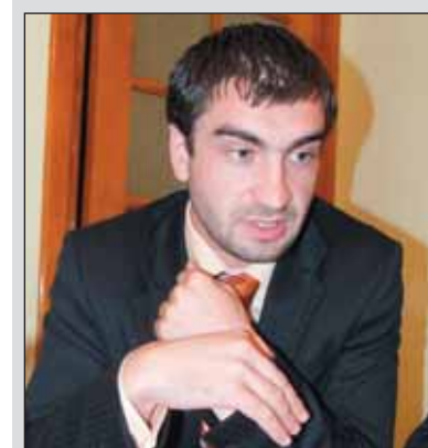
Victor LUTENCO, reprezentantul Organizației Internaționale pentru Migrație

roceanu, a mulțumit celor prezenți la primele audieri publice și a remarcat că pentru viitor CDC va continua activitatea de documentare și de încurajare a populației de a vorbi despre problemele cu care se confruntă și de acționa atunci