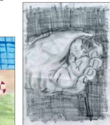
«Жизнь ребенка в ваших руках... не дайте ему упасть».