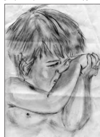
«Каждый ребенок имеет такое же право на жизнь как ты»