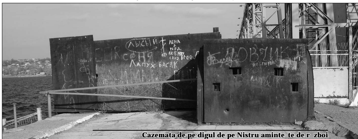
Cazemata de pe digul de pe Nistru amintește de război