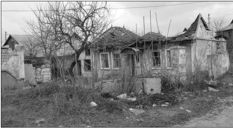
Zeci de case din Corjova zac în ruine

Cei care acceptă condițiile de înregistrare a automobilelor, impuse de autoritățile secesioniste, nu pot circula cu acestea decât în câteva state din CSI. În plus, ei sunt supuși unor taxe suplimentare, care, practic, duc la dublarea